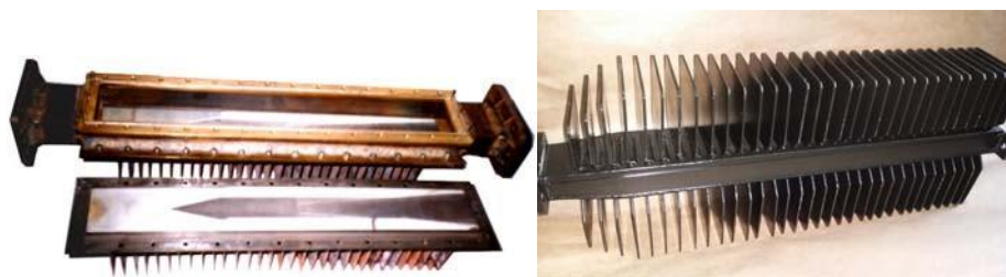
Макет и штатная нагрузка

1. Разработана и внедрена в промышленное производство согласованная нагрузка непрерывного СВЧ-излучения высокого уровня мощности. Нагрузка предназначена для эффективного поглощения мощного СВЧ - излучения при работе в качестве аттенуаторов и эквивалентов антенн.